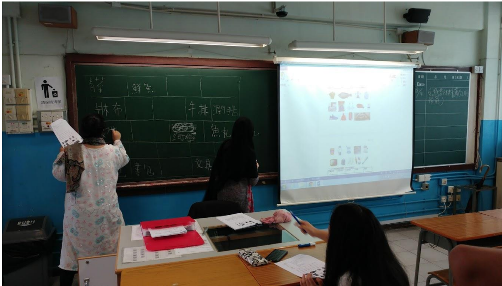
(學生在黑板上寫字詞)